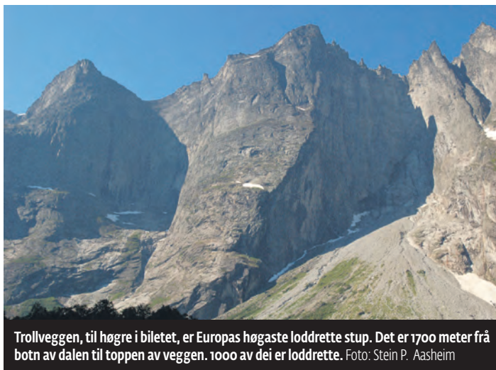
Trollveggen, til høgre i bildet, er Europas høgaste loddrette stup. Det er 1700 meter frå botn av dalen til toppen av veggen. 1000 av dei er loddrette.