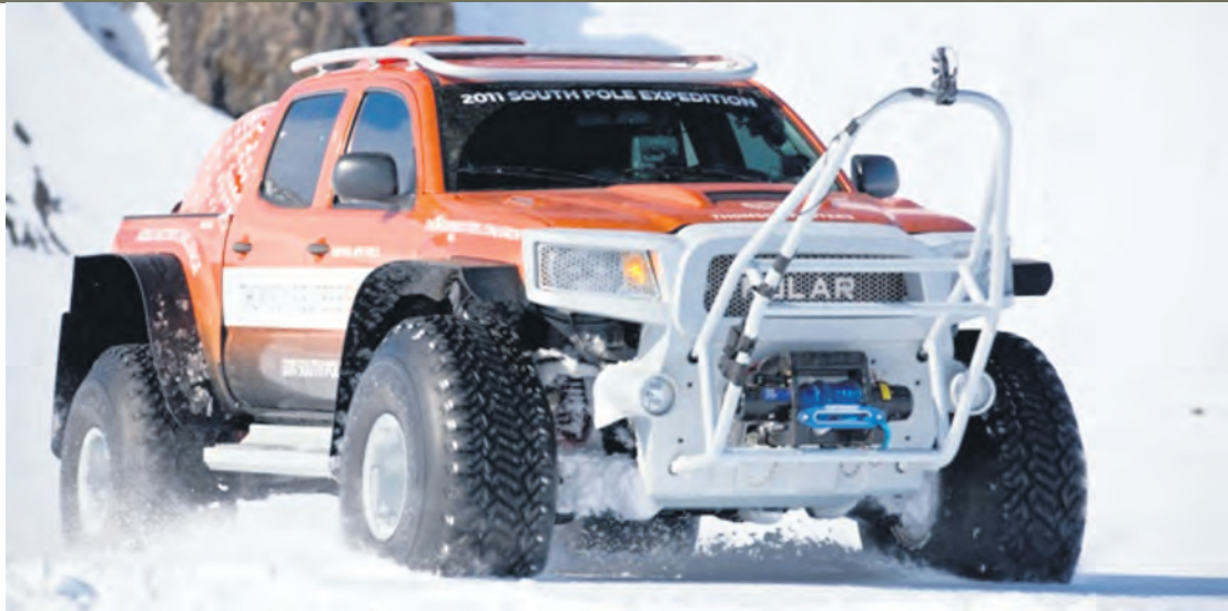
Køyretøyet som har fartsrekord til Sørpolen. 1 døgn, 15 timar og 54 minutt.

Mange har nok høyrte om det – at dei før i tida åt pemmikan på tur. Dei store polarfararane, til dømes. Det er vel færre som har smaka det. Og de har for så vidt ikkje gått glipp av noko. Men pemmikan er opphavleg måten indianarane konserverte kjøt på. Som turmat vart pemmikan fabrikkframstilt av mellom anna turka oksekjøt, oksetalg og ulike former for stivelse. Dette gav ei komprimert, haldbar og næringsrik niste – om ho ikkje er sakna i dagens tursekk.