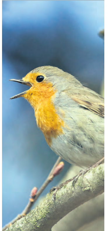
Raudstrupen, ein gullstrupe.