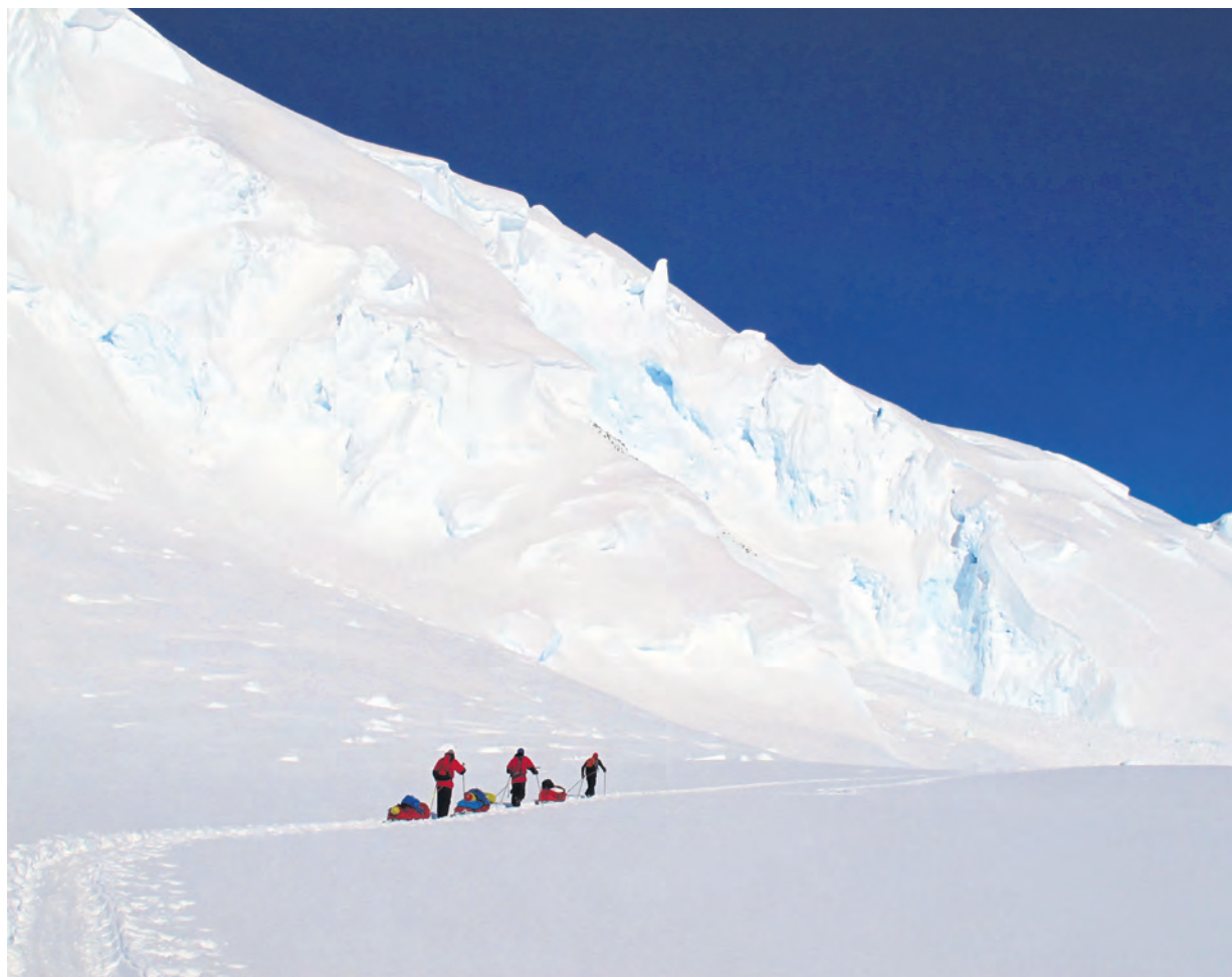
Mot øvste del av Axel Heiberg-breen – under Mount Don Pedro Christoffersen.